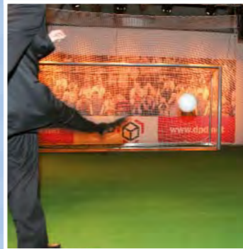
Bramka 5m x 2m zabezpieczona siatką ochroną po bokach i z tyłu.

Kick-Point występuje w różnych wielkościach i może być dopasowany do każdego pomieszczenia. Odpowiedni na wszystkie powierzchnie, w budynku czy na zewnątrz.