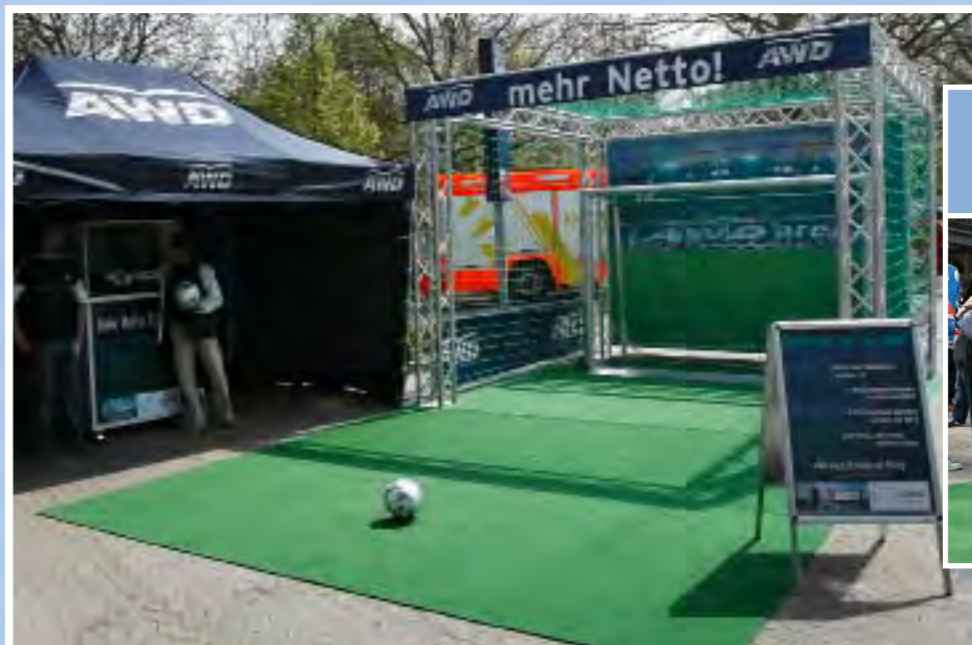
Bramka 3m x 2m, obudowana stalową konstrukcją oraz dopasowana do każdego eventu.